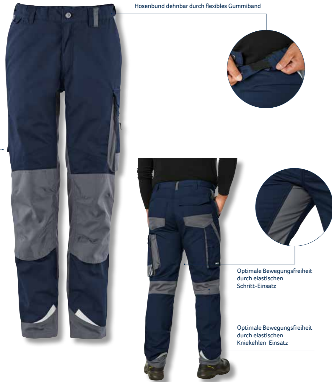
Hosenbund dehnbar durch flexibles Gummiband